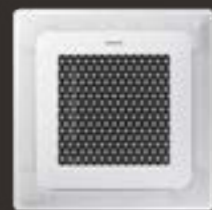
WindFree™ 4-vejs kassette