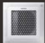
WindFree™ Mini 4-vejs kassette